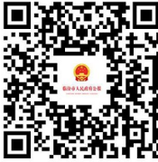
临汾市人民政府公报

主管主办单位:临汾市人民政府办公室 编辑印发单位:临汾市政府公报编辑中心 地址:临汾市解放西路市府街 电话:(0357)2091150